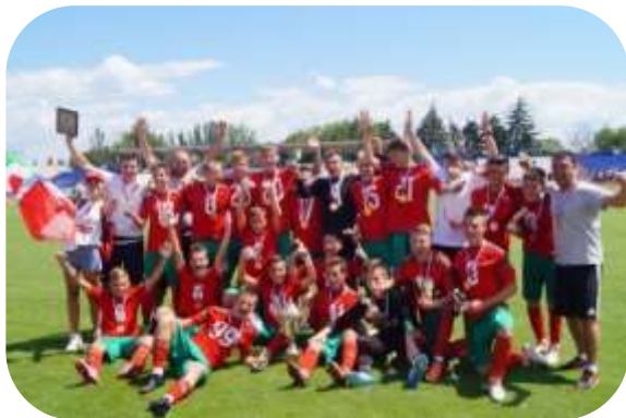
Закупка формы для школьной футбольной команды