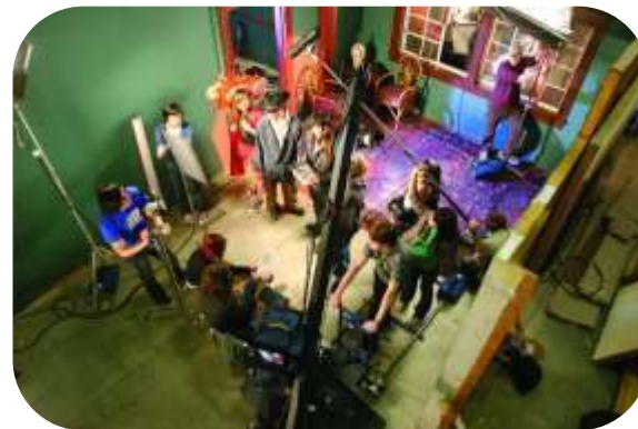
Оборудование школьной киностудии