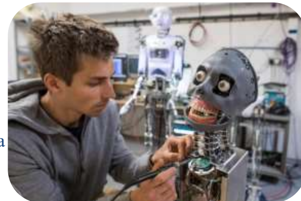
Приобретение материалов для кружка робототехники/ кабинета труда