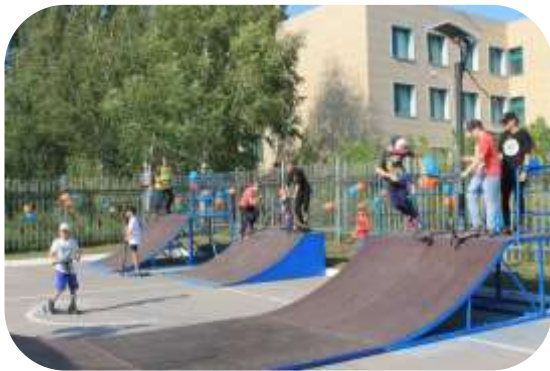
Устройство скейт- площадки на территории школы